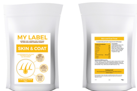
Przykładowy projekt etykiety w celach ilustracyjnych

Świeżo przygotowany łosoś 45%, bataty 18%, suszony łosoś 8%, olej z łososia 7%, ziemniaki, groszek, świeżo przygotowany pstrąg 5%, lucerna, suszone jajko, minerały, suplement omega 3 , algi morskie