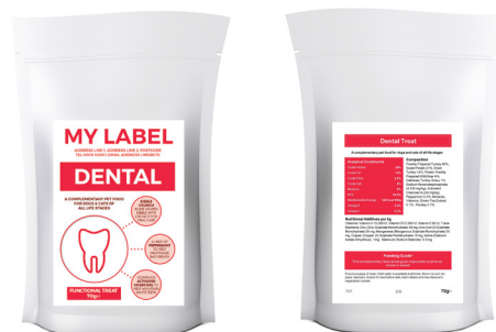
Przykładowy projekt etykiety w celach ilustracyjnych

Świeżo przygotowany indyk 46%, bataty 21%, suszony indyk 14%, ziemniaki, świeżo przygotowana dziczyzna (dzik) 4%, celuloza, wywar z indyka 1%, heksametafosforan sodu 4,530 mg/kg, węgiel aktywny 4,230 mg/kg, mięta pieprzowa 0,3%, minerały, ekstrakt z zielonej herbaty 0,1%, pietruszka 0,1%.